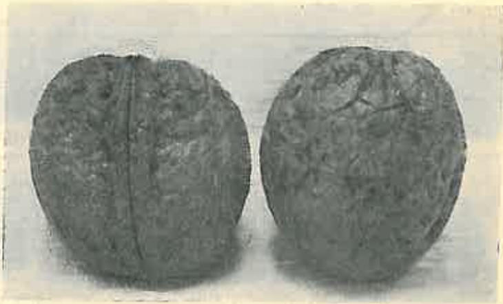
Figura. II. Nuci sferice, în mărime naturală.

În 1936, pentru a asigura cumpărarea nucilor la un preț rezonabil și mai ales pentru a asigura tuturor instituțiilor interesate cumpărarea nucilor din Sibiușel, avându-se în vedere capacitatea limitată în privința producției de nuci de calitate bună, Camera de Agricultură a județului Hunedoara a luat inițiativa de-a procura ea nuci pentru toate instituțiile interesate, care i se adresează, în baza îndrumărilor date de Minister.