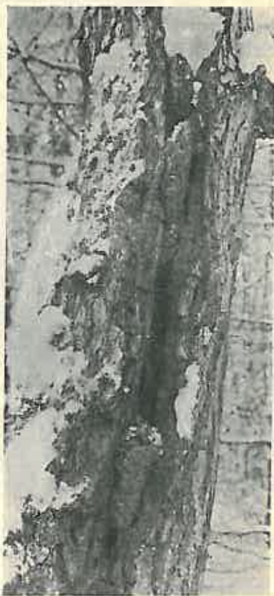
Fig. 2. — Conuri de molid prinse în crăpătura scoarței unui stejar.

În fine cea mai originală nicovală, ce am văzut vreodată, a fost instalată într'o cioată de molid, pe jumătate putredă, la cca. 30 cm. deasupra solului; pasărea a făcut o gaură adâncă în mijlocul ei, unde introducea conurile de molid, astfel că partea superioară rămânea afară; altă scobitură la marginea cioatei cuprindea al doilea con prins mai mult lateral. Conurile de brad-douglas le-am găsit în furci de salcâm; unul sigur am găsit odată simplu pus pe o ramură groasă, unde pasărea probabil îl fixa cu giarele până ce îi scotea semințele. Nu știu cum se fixează conurile de molid balcanic; le-am găsit numai pe pământ sub arbore. În general locurile de fixarea conurilor pot fi la înălțimi foarte variabile, uneori chiar foarte jos deasupra solului; de preferință însă sus în coronament. De multe ori pe același arbore se găsesc 4—5 locuri de fixarea conurilor, fie în furci, fie în scobituri.