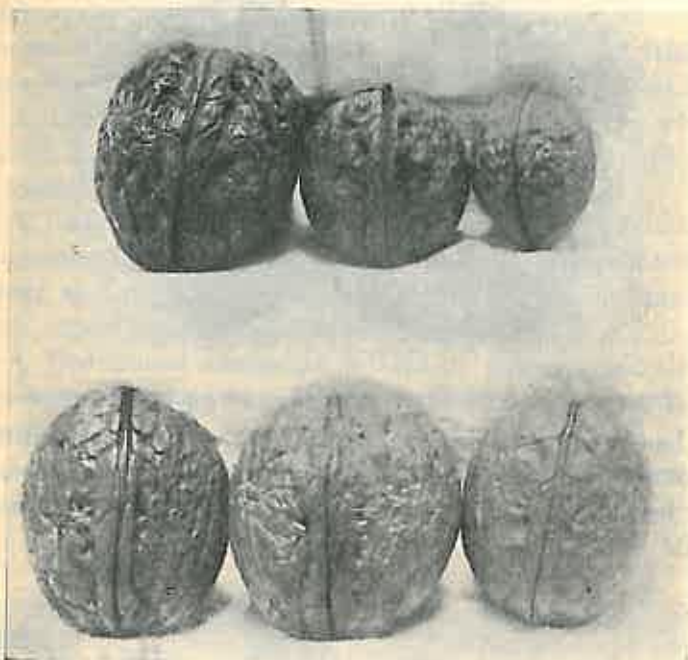
Figura V. Rând I. Nuci de calitate bună din alte localități.

La alte nuci deși coaja este mai subțire, totuși din cauza nervurilor și a brazdei de sudură proeminentă, spargerea se face mai greu (sunt mai costelive) miezul nu este așa de plin și este mai puțin uleios.