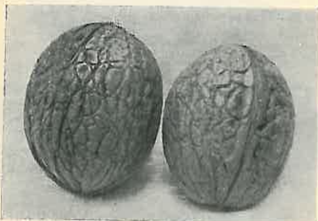
Figura III. Nuci ovale, în mărime naturală.

În Sibişel, deși este o localitate cu un vechiu trecut în privința producției nucilor, în mod cu totul nejustificat, se găsesc o mulțime de varietăți de nuci, ceea ce dovedește că fiecare arbore își are caracteristicile sale, cari se păstrează și se transmit. Dau mai jos o fotografie a colecției de nuci făcută de subsemnatul în comuna Sibişel în toamna anului 1936, în care se observă varietățile existente. Aceste varietăți au fost adunate dela circa 10—12 proprietari, fiecare din ei având cât 3—4 varietăți.