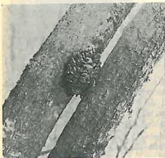
Fig. 3. — Con de pin negru prins între două ramuri ale unui jugastru.

Fiecare ciocănitoare are pe locul, unde obișnuiește a se hrăni, mai mulți arbori-nicovală; numărul obișnuit pare a fi 5—6 pentru