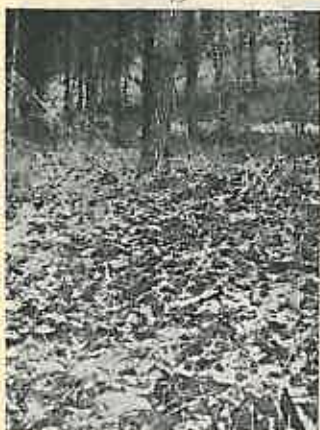
Fig. 6. — Grămadă de conuri de brad-douglas sub un salcâm-nicovală.

Sub arborii-nicovale se adună o mulțime de conuri aruncate jos de pasăre după ce a scos semințele. Numărul lor poate ajunge