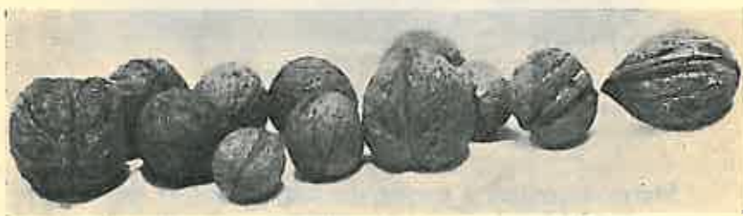
Figura VII. Nuci din diferite localități, de diferite calități.

Din producția totală de cca. 5000 kg. ce se realizează în anii cu anotimp favorabil, se poate selecționa circa 2—3 mii kg. sămânță bună. În anii mai puțin favorabili nu se va putea selecționa mai mult de 1—2 mii kg.