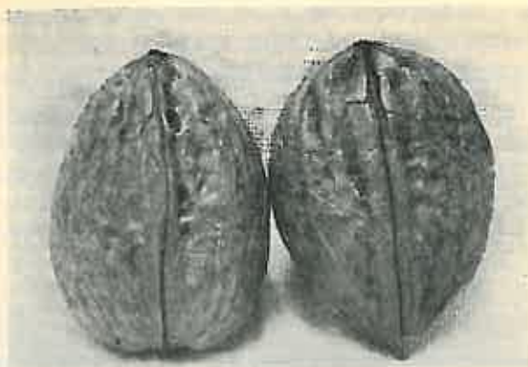
Figura VI. Nuci din Sibîșel, în formă de parâ și parâ inversată.

Nucile neselecționate nu vor avea nici un avantaj față de cele locale din alte regiuni. Vor da chiar nuci de calitate inferioară, ceea ce se poate ușor constata și din clișeu No. IV, unde se arată o colecție de nuci de Sibîșel.