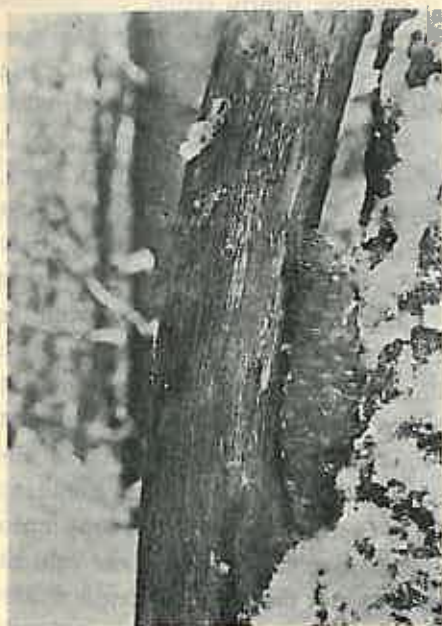
Fig. 1. — Con de molid prins într'o furcă de stejar.

balkanic ( Picea omorica Pančić). Se pare că sunt preferate semințele celor două specii de pin; molidului i se acordă atenție mai mare când sunt fructificații abundente (iarna 1935—36 la Gurghiu), și se neglijează când sunt conuri puține (iarna 1936—37, când numai în timpul gerurilor celor mai mari, am văzut 1—2 ciocănituri și în