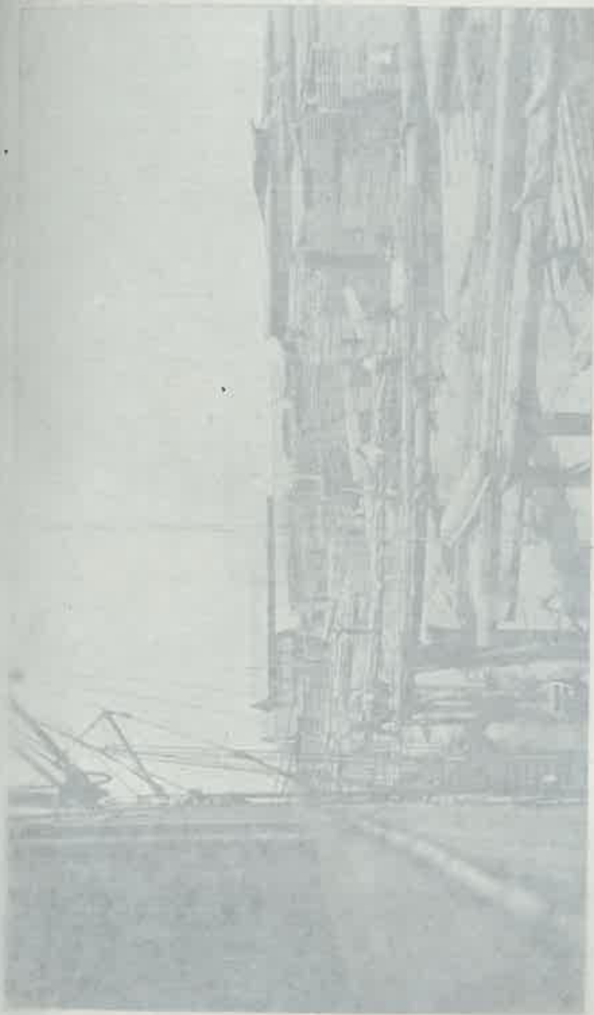
Paradisi Gleditsch — Fabriekgeboude der Tempelsteinsche fabriek, vanden Duisend Nieuwe en veldwilde de polder van Langenlaan 2, M. Rensdijk. L'usine de Gleditsch sur le Dommel, Gleditsch des bois de la ville de Pilsener, Le nouveau Assam. The factory for Holzschlachte near the Gleditsch.