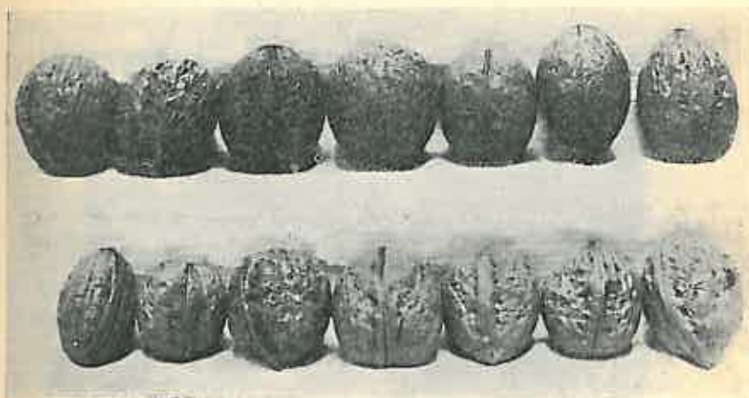
Figura I. O colecție de nucii din Sibiu.

țurilor care apărea cu atât mai nejustificată cu cât se făcea între diversele instituții ale Statului. Producătorii au ținut la preț știind că delegații instituțiilor nu pot sta în localitate mai mult de 2—3 zile și mai ales având asigurată vânzarea nucilor în străinătate. Datorită acestei concurențe, s'a ajuns în 1935 să se plătească prețul de 35 lei de kg. La kg. intră 70—75 nuci, adică revine la un leu 2 nuci. Dacă ținem în seamă faptul că în primăvara anului 1935 a fost un ger târziu care a atacat o mare parte a nucilor, ceea ce a făcut să se producă a 2-a înflorire, și drept urmare o recoltă slabă în cali-