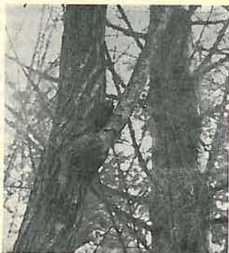
Fig. 5. — Con de brad-douglas prins în furcă de salcâm.

Vătămările ce se aduc conurilor sunt diferite, după esențe. La pin silvestru, în cele mai multe cazuri, ciocănițoarea se mulțumește