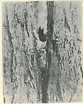
Fig. 4. — Conuri de brad-douglas prinse în furcă de salcâm.

de coajă sboară jos; în momentul când conul se rupe, îl ține strâns bine cu ghiarele unui picior, iar cu celălalt se agață de lujer; astfel rămâne o clipă balansând în aer, suspendată de un picior și ținând în piciorul al doilea conul greu, care o trage jos; imediat însă îl prinde cu ciocul și se urcă sus pe lujer. Apoi își ia sborul spre nicovală; de obicei ține conul de mijloc deacurmeziș; altădată în lung astfel că jumătatea lui îi atârână deasupra capului; sborul îi este mult îngreuiat, e mai mult o cădere oblică către nicovală. Ajunsă aici de multe ori, până să se agațe bine, scapă conul jos; în cazul acesta prea rar îl ridică din nou de pe pământ, scoborând după el prin sărituri deandratelea în jos, în lungul trunchiului; mai des îl lasă