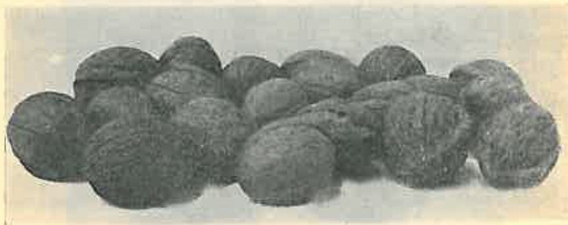
Figura IV. Nuci din Sibîșel, neselectate.

Mărimea: 42—50 m/m lungime, 35—40 m/m grosime peste brazdă și 35—40 m/m peste mijlocul coajei.