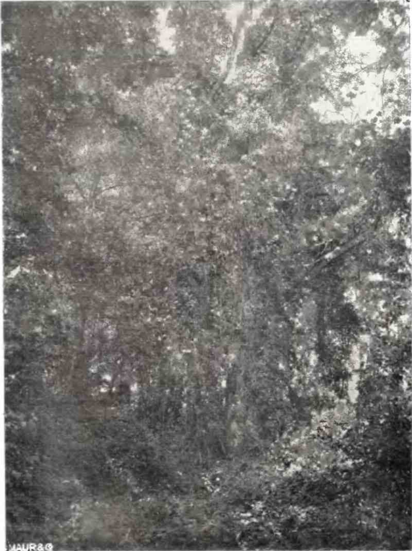
Aspect forestier în Delta Dunării Aspect forestier dans le Delta du Danube Waldbild aus dem Donaudelta